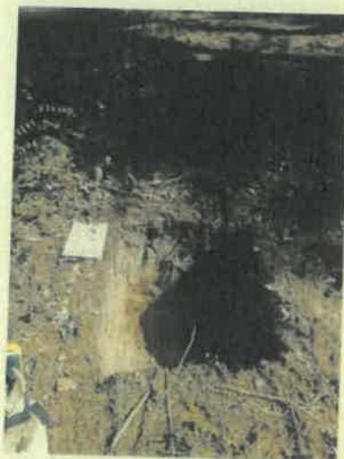
Miháld 6 E (1) környezet