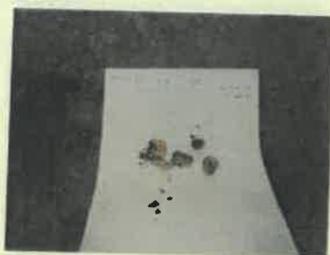
Miháld 6 E (2) eredmény