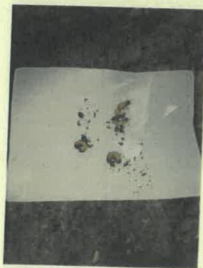
Galambok 10 I eredmény