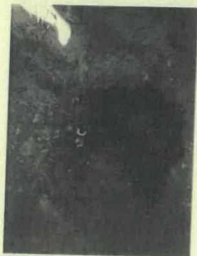
Miháld 6 E (1) mintagödör

Az erdőrészlet területe 6,63 ha. Jelenlegi természetességi besorolása kultúrerdő. A Natura 2000 hálózathoz tartozik, nem védett. Az erdőrészletben 2 mintavétel történt. A képeken látható a mintagödör belseje, a mintavétel eredménye, valamint szelvény közvetlen környezete.