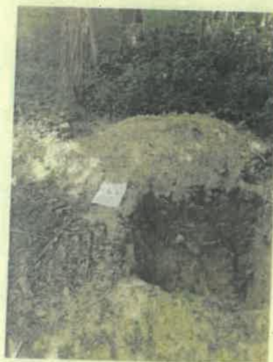
Galambok 10 I környezet

A mintavétel eredménye alapján megállapítható, hogy az erdőrészt cserebogár pajorral fertőzött. A pajorfeltárás eredményeképpen kérelmezzük, hogy a fahasználat módja TRV, az erdőfelújítás jellege TRVF, módja MEST, célállománya Tölgyes (T) vagy hazai egyéb kemény lombos (H-EKL) legyen. Az erdőfelújítást mesterségesen „csöves” technológiával tervezzük végrehajtani.