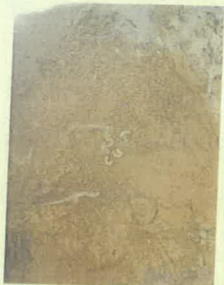
Miháld 6 E (2) mintagödör