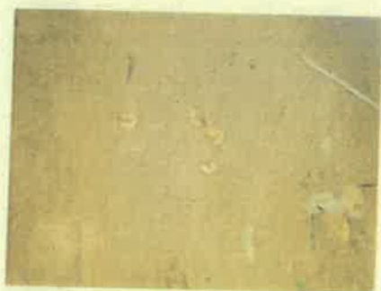
Galambok 10 I mintagödör

Az erdőrészt területe 1,24 ha. Jelenlegi természetességi besorolása átmeneti erdő. A Natura 2000 hálózathoz tartozik, védett. Az erdőrésztben 1 mintavétel történt. A képeken látható a mintagödör belseje, a mintavétel eredménye, valamint szelvény közvetlen környezete.