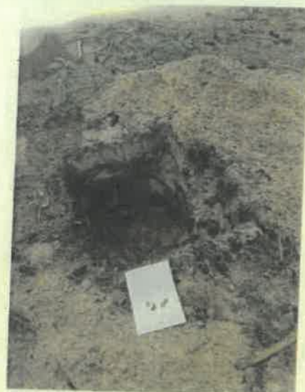
Miháld 6 E (2) környezet

A mintavételek eredményei alapján megállapítható, hogy az erdőrészt cserebogár pajorral fertőzött. A pajorfeltárás eredményeképpen kérelmezzük, hogy a fahasználat módja TRV, az erdőfelújítás jellege TRVF, módja MEST, célállománya hazai egyéb kemény lombos (H-EKL) vagy idegenhonos kemény lombos (I-EKL) legyen. Az erdőfelújítást mesterségesen „csöves” technológiával tervezzük végrehajtani.