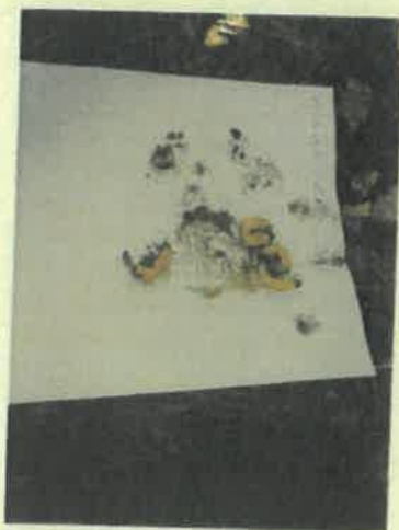
Miháld 6 E (1) eredmény