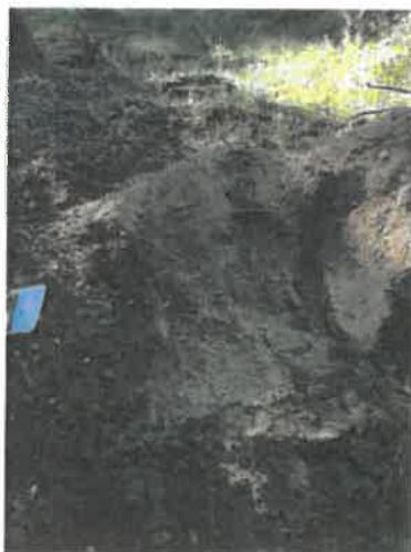
Homokkomárom 8 D szelvény környezete