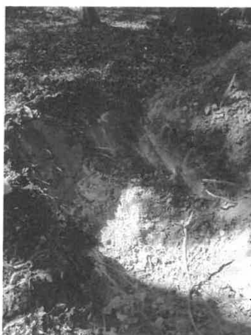
Homokkomárom 19 F szelvény környezete