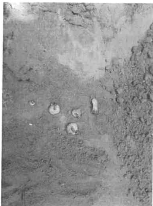
Homokkomárom 17 H minta