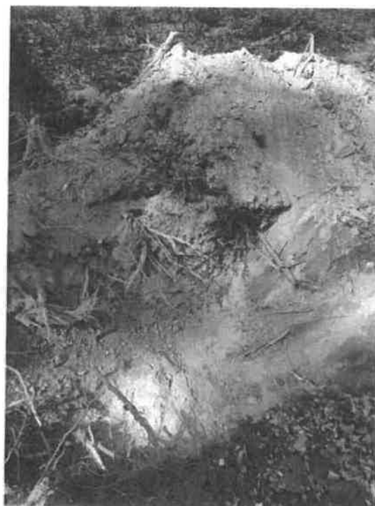
Homokkomárom 17 B minta