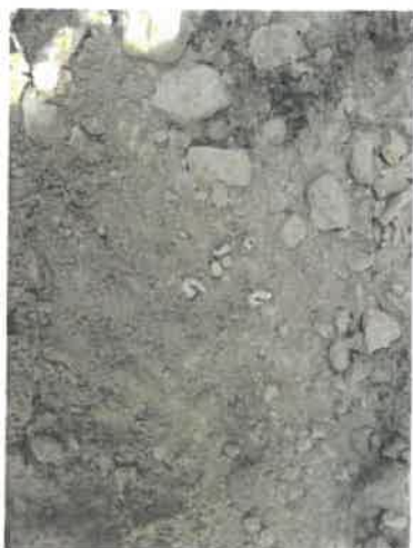
Homokkomárom 8 D minta

Az erdőrészlet 4,88 ha. Jelenlegi természetességi besorolása természetyszerű erdő. A Natura 2000 hálózathoz nem tartozik. Az erdőrészletben 1 mintavétel történt. A képeken látható a mintavétel eredménye, valamint szelvény közvetlen környezete.