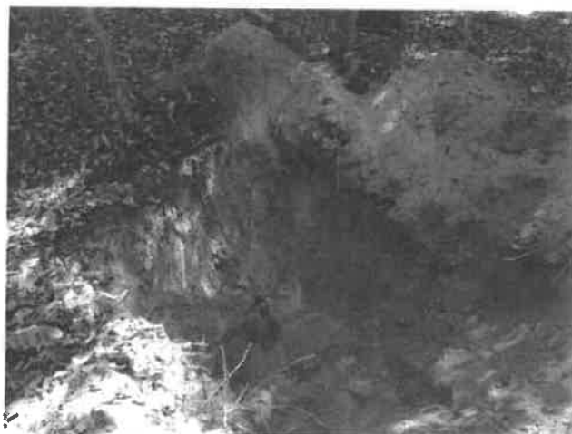
Homokkomárom 17 H szelvény környezete

A mintavétel eredménye alapján megállapítható, hogy az erdőrészt cserebogár pajorral fertőzött. A pajorfeltárás eredményeképpen kérelmezzük, hogy a fahasználat módja FVV helyett TRV, az erdőfelújítás jellege TRVF, módja MEST, célállománya Tölgyes (T) legyen. Az erdőfelújítást mesterségesen „csöves” technológiával tervezzük végrehajtani.