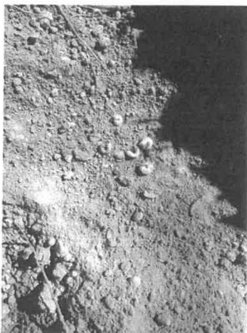
Homokkomárom 19 F minta

Az erdőrészt 1,03 ha. Jelenlegi természetességi besorolása természetsterű erdő. A Natura 2000 hálózathoz nem tartozik. Az erdőrészt 1 mintavétel történt. A képeken látható a mintavétel eredménye, valamint szelvény közvetlen környezete.